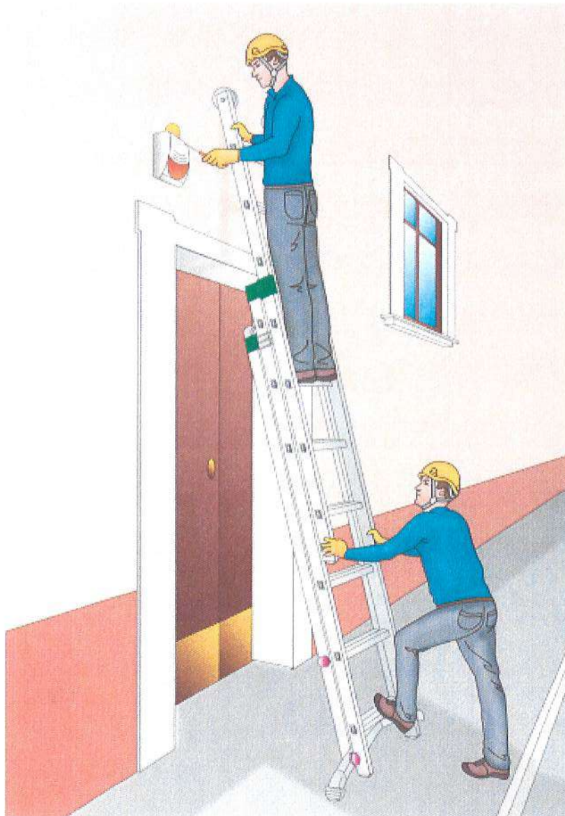
Figura 5 - Esempio di scala trasformabile a tre tronchi in configurazione di appoggio