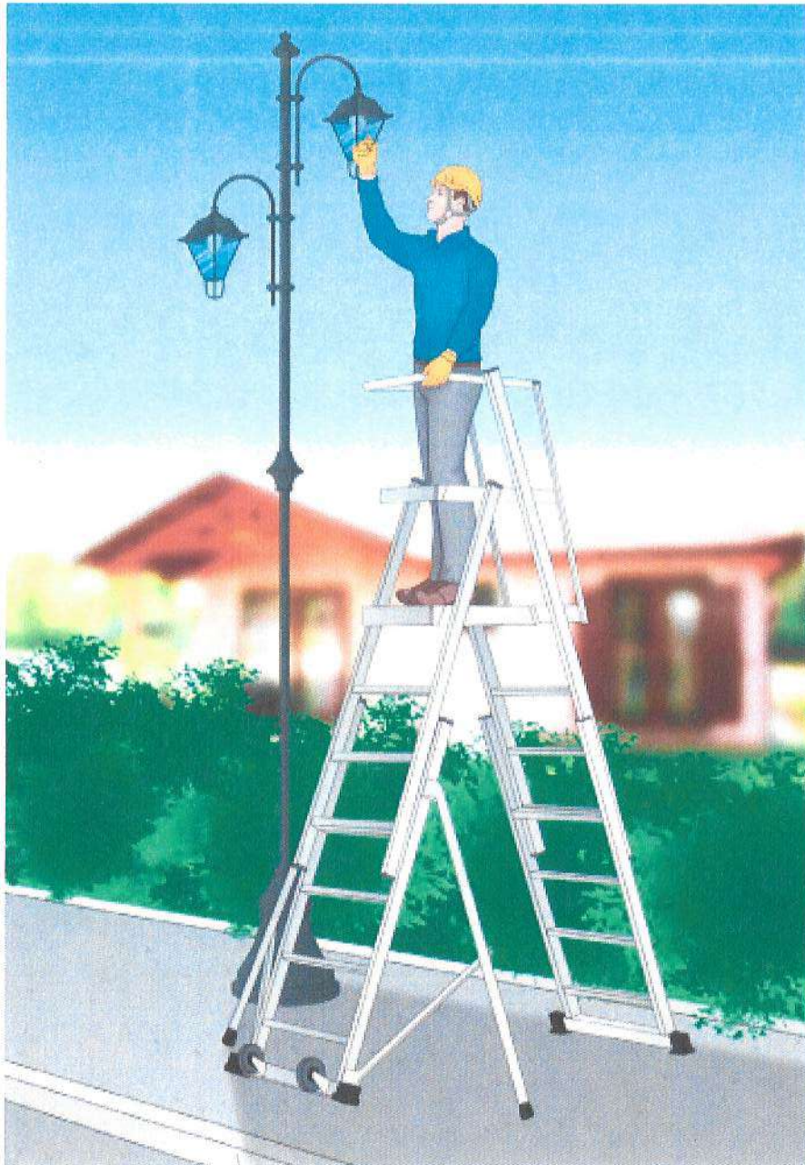
Figura 3 - Esempio di scala mobile con piattaforma, ai sensi della UNI EN 131-7

Aggiornamento del Documento di Valutazione dei Rischi (ex art. 28 del D. Lgs. 81/08 e s. m. i.)