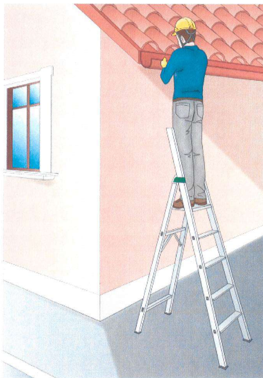
Figura 4 - Esempio di scala doppia

Aggiornamento del Documento di Valutazione dei Rischi (ex art. 28 del D. Lgs. 81/08 e s. m. i.)